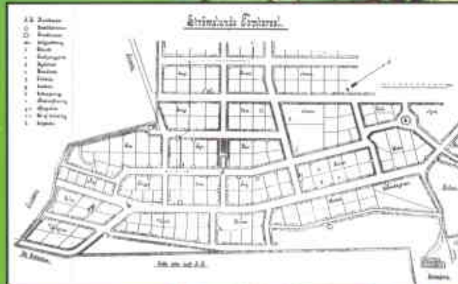
Ingenjör Alberts plan över "Egnahemskolonin" Strömslund

är Sveriges äldsta planerade egnahemsområde. Där anlades trånga rensningsgränder för uppsamling av avfall - de s k "slaskegatorna". En av dessa har nu renoverats och öppnats för allmänheten.