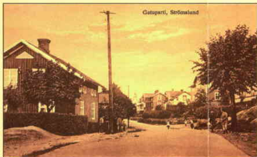
Äldre foto, Strömslundsgatan mot norr

Kvarteren följer ett rutnätsmönster och husen byggdes friliggande. Allmänna byggnader såsom frikyrkor, samlingslokaler och skolor placerades i regel på de högsta höjderna i området. Rakt igenom kvarteren anlades rensningsgränder med dränerings- och avloppssystem med slaskbrunnar och sophus. Utmed dessa låg också avträden, slaktbodar, svinhus, brygghus och vedbodar. Avfallet blev därmed lätt åtkomligt för de uppsamlingskärror som drogs fram genom gränderna. Dessa kom i folkmun att kallas "slaskegater".