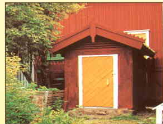
Strömslunds enda bevarade sophus